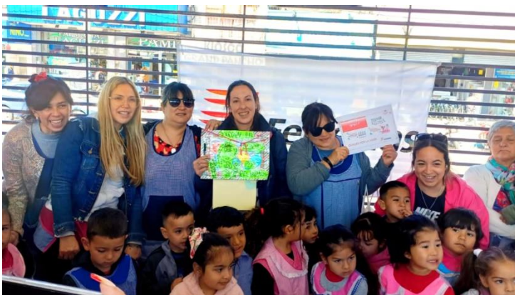
Jardín N°917 Sala de 4