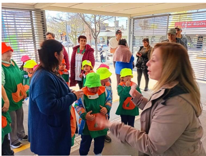
Jardín N°927 Sala Roja