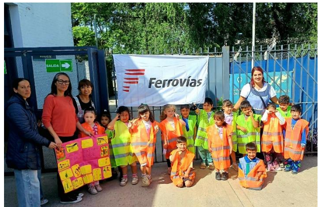
Jardín N°927 Sala Verde

Los estudiantes, acompañados por personal Centro de Atención al Pasajero, recorren una estación previamente designada en donde se abordaron aspectos claves del uso cotidiano del servicio: