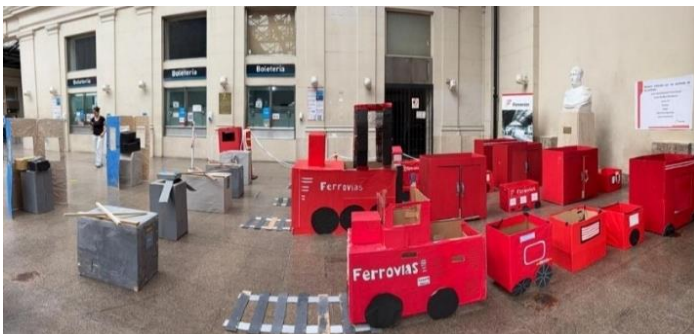
Hall estación Retiro