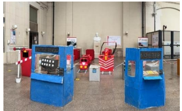
Hall estación Retiro