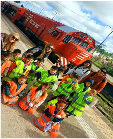
Jardín N°946 Multisala