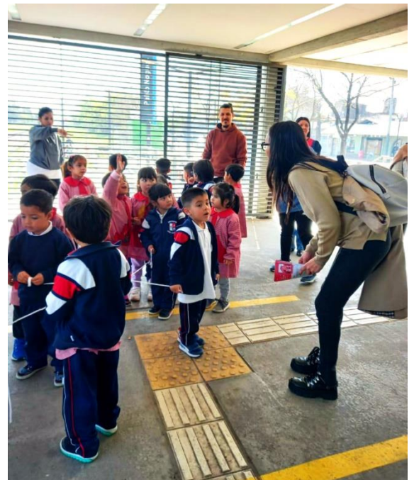
Jardín "El Grillito" Sala de 5