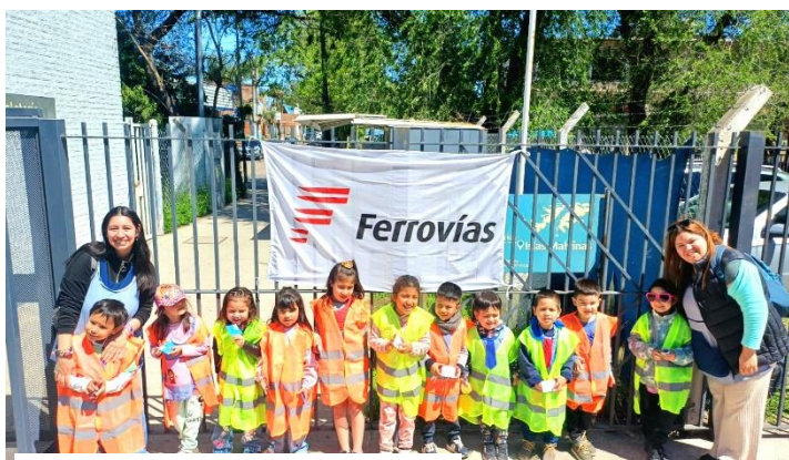
Jardín N°927 Sala de 4