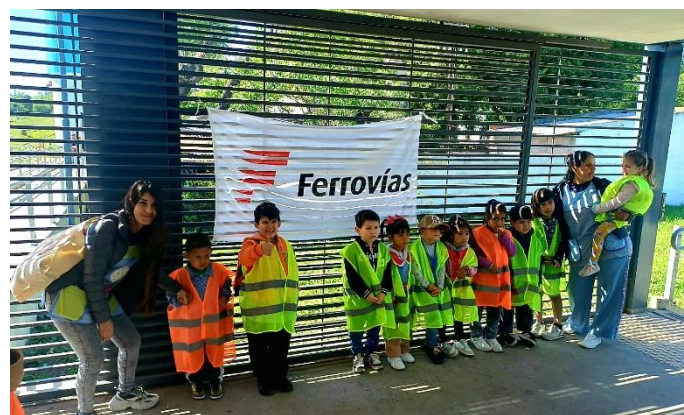
Jardín N°946 Sala Verde