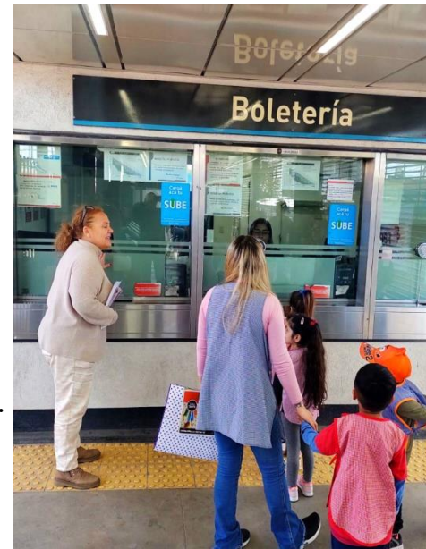
Jardín N°924 Sala de 4