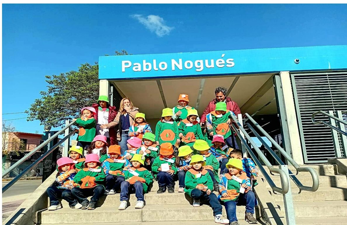
Escuela Cornelio Saavedra Sala de 5

La propuesta se realiza con visitas guiadas a las distintas estaciones de la línea coordinadas por el Centro de Atención al Pasajero, con charlas y actividades prácticas dirigidas a niños y niñas de las escuelas de nivel inicial de los municipios que recorre el ferrocarril.